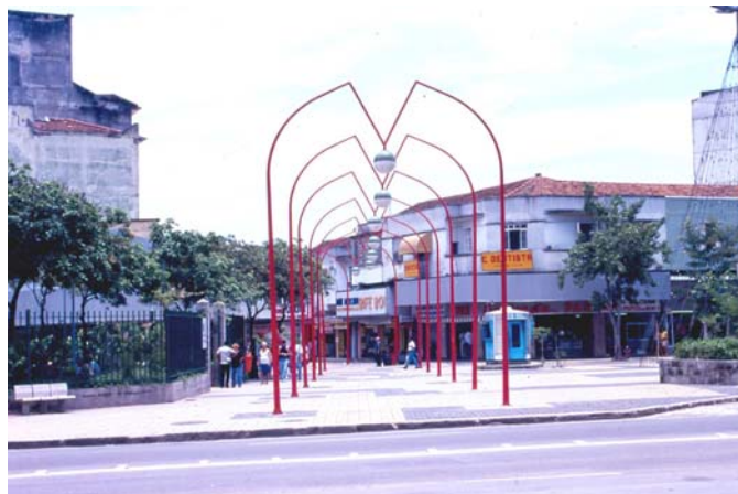
Figura 13: Rua dos Romeiros recém inaugurada

A demarcação do percurso acontece na área “embaixo”, na Rua dos Romeiros. Além dessa intervenção principal, o projeto buscou ainda valorizar a tradição festeira do bairro com construção de pequeno palco para espetáculos e ampliação ou regularização da área de domínio dos pedestres. Essas intervenções mostram o reconhecimento em um mesmo espaço físico dos dois “ambientes” da festa.